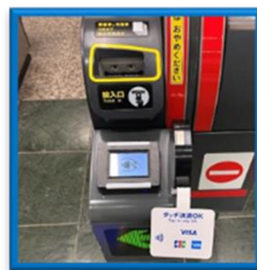
(出場時に専用端末にかざす)