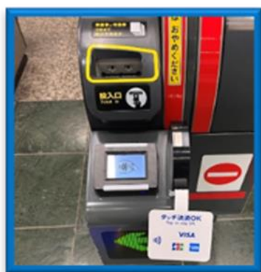
(入場時に専用端末にかざす)