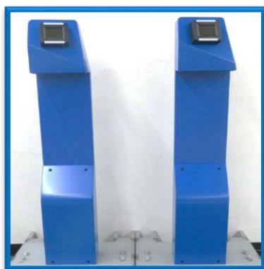
(ポール型専用端末)